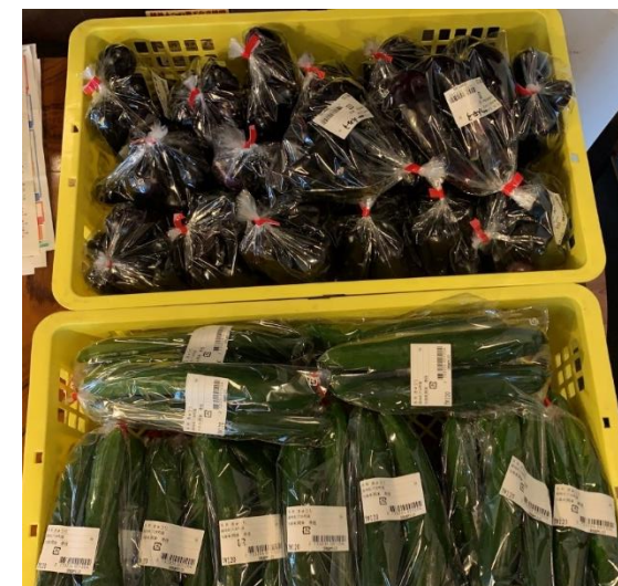
袋詰めして店頭へ